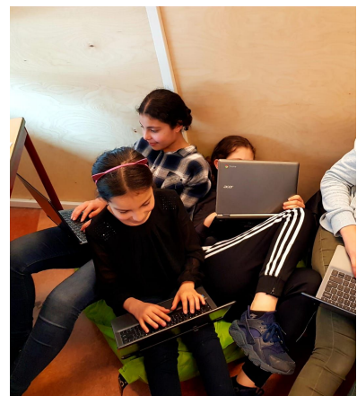
Veel informatie opzoeken op de chromebooks (groep 8)