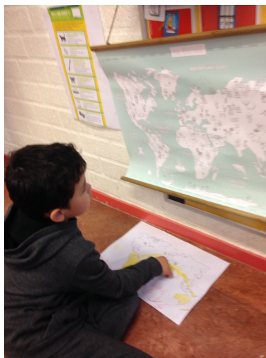
Waar komen de bananen vandaan? (groep 3)