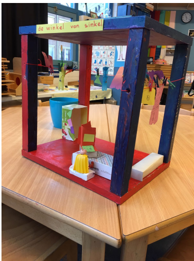
Zelf bedacht, gezaagd, geschuurd en geschilderd (groep 1/2)