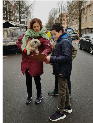
Een onderzoekje op de Dappermarkt (groep 8)