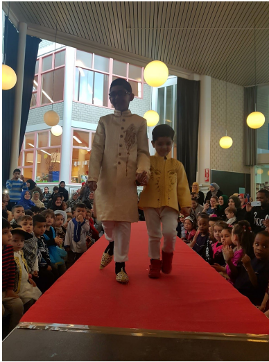
een modeshow als afsluiting (groep 1/2)