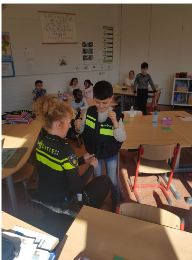
Wat doet de politie allemaal? (groep 4)

Zie hieronder een kleine foto-impresie van de verschillende projecten: